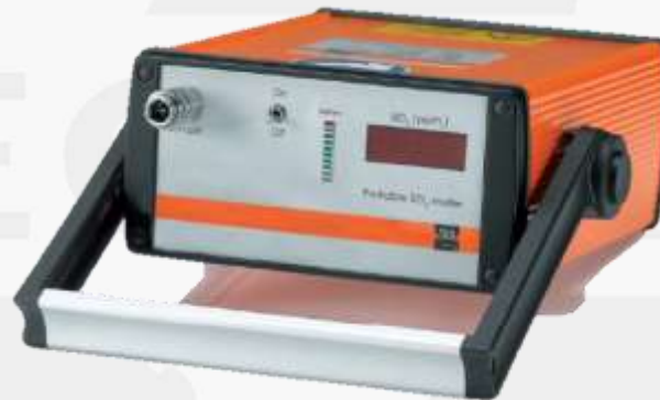
Teor de SO 2