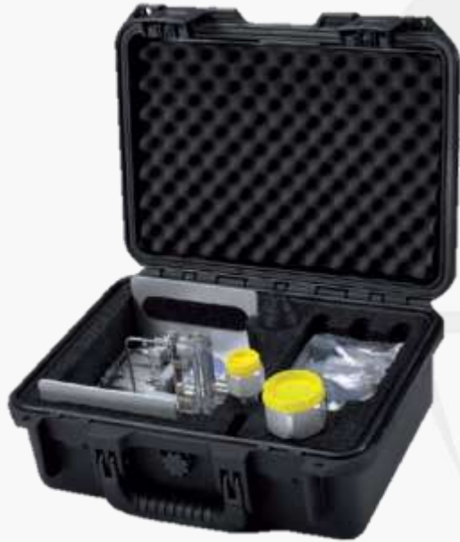
Produtos em Decomposição HF, SO 2 , Neblina de Óleo