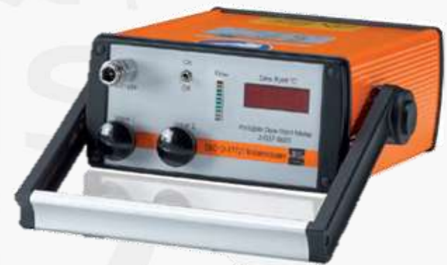
Teor de umidade